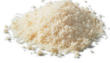
جبن البارميزان في مسحوق