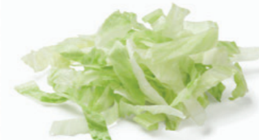
شرائح الخس الجبلي