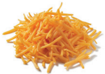
مسحوق جبن شيدر

أنواع القطع: التقطيع إلى مكعبات، التقطيع إلى شرائح، التقطيع