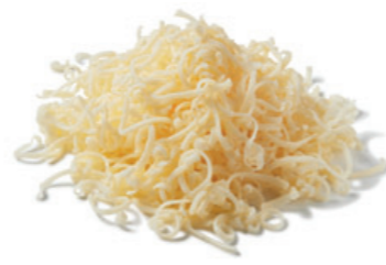
جبن ايمنتال في مسحوق