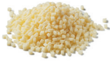
مكعبات جبن موزاريلا