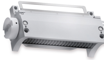
Robuster Hochleistungs Würfelschneider mit SureCut Unit [3]