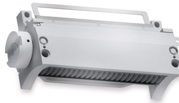
Robusta cubitadora de alta capacidad dotada de la unidad SureCut [3]