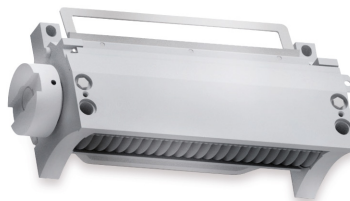
Cubettatrice robusta, di elevata capacità, dotata dell'unità SureCut [3]