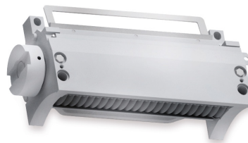
Solidna, wytrzymała kostkownica z modułem SureCut [2]