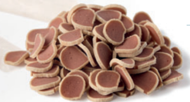
Trockenextrudierte dünne Scheiben