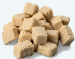
Frisch gefrorene Würfel