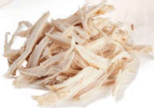
Hähnchenfleisch mit hand-pulled-look (grob)

Ergebnisse von hochwertigem „Pulled“-Look und Stücke