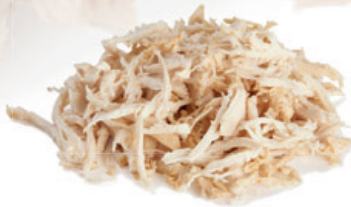
Hähnchenfleisch mit hand-pulled-look (fein)