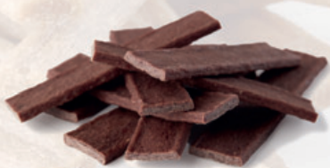
Trockene breite Stäbe