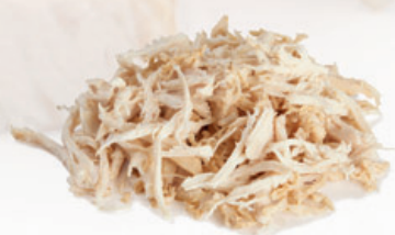
Hähnchenfleisch mit hand-pulled-look (fein)

Ergebnisse aus hochwertigem Streifenschneiden und hand-pulled-look