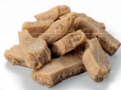
Stücke von extrudiertem Produkt

Band-Schneider, konzipiert für das Würfeln und Streifenschneiden bei hoher Leistung