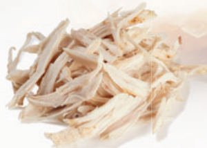
Hähnchenfleisch mit hand-pulled-look (grob)