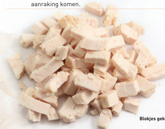
Blokjes gekookte kip