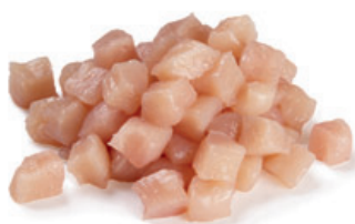
Blokjes rauwe kip