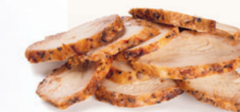
Op smaak gebrachte schijfjes kip