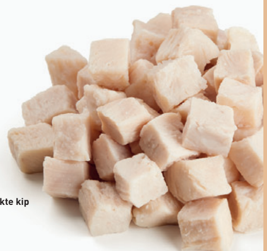
Blokjes gekookte kip