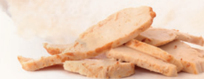
Schijfjes gekookte kip