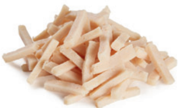
Reepjes gekookte kip